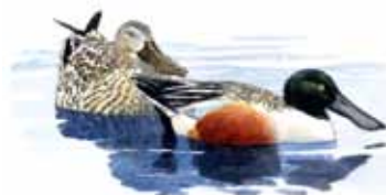
Canard souchet